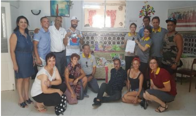
Besuch des Kinderheims / Visit of orphanage „La voix de l'enfant“