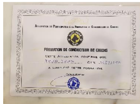
Hundetraining Zertifikat / Dog training certificate