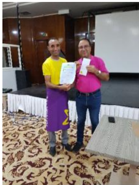
Mitarbeiter des Monats / Employee of the month