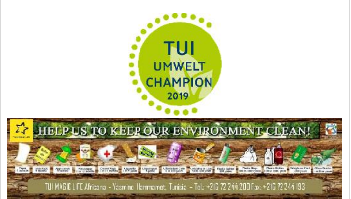
Infos & Certificates