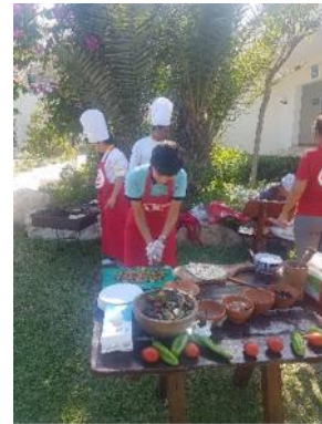
Tunesischer Kochkurs / Tunisian Cooking Class