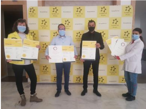
Cristal Food, Dine, Aqua, Pool, Room, SPA, Safety, POSI Check Certificates