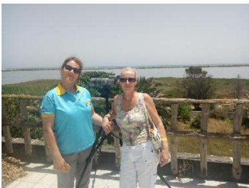
Umweltausflug / Environmental Excursion