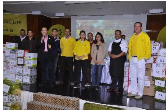
Tombola und Party zum Jahresende / End of the year tombola & Party