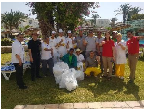
Strand & Hotel Reinigung / Beach & Hotel Cleaning