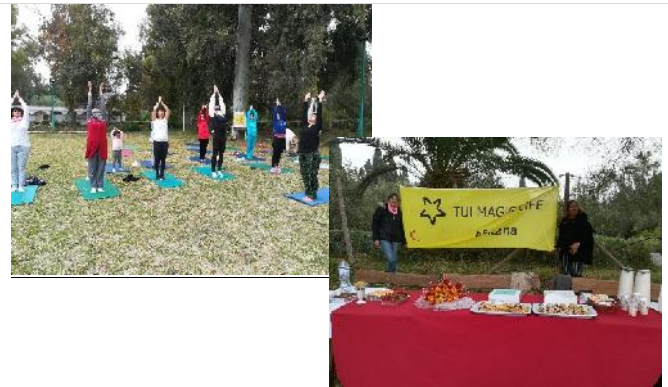
Sport Event sponsoring / Sponsoring of Sports Events