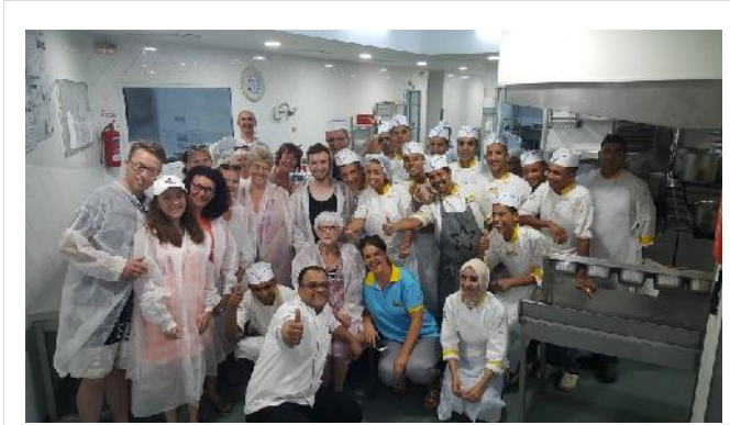
Küchenbesuch / Kitchen visit